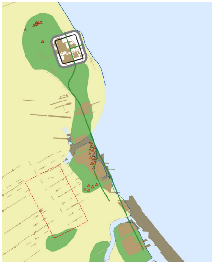
Figuur 4 Het nieuwe kaartje van Romeins Valkenburg uit het nominatiedossier van Unesco, bewerkt door Jasper de Bruin. De stippellijn geeft de plaats weer waar hij het campagnekamp vermoedt.

Vervolgens onderbouwt hij zijn case voor de campagnekamp-hypothese. “In de gracht lagen pluggen van een (castellum)wal, en ook is er in de omgeving aardewerk uit de eerste helft van de eerste eeuw gevonden. Er is het fundament voor een toren of poort naast die gracht gevonden, precies zoals je bij een castellum zou verwachten. Dat fundament is opgetrokken uit het oudste limeshout dat is teruggevonden: 39 na Chr. plus of min zes jaar. Die datering maakt het