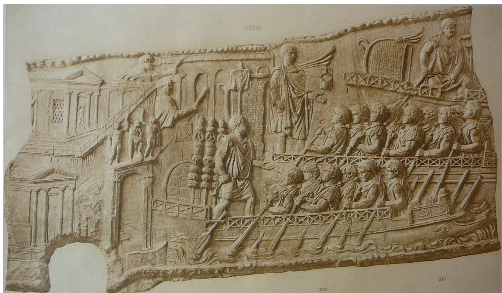
Figuur 2 Liburna's met twee roeibanken (biremen) afgebeeld op de Zuil van Trajanus 107-112 n. Chr., ingewijd 113 n. Chr., Rome

kunnen ze vuistgrote stenen afvuren tot aan de overkant.