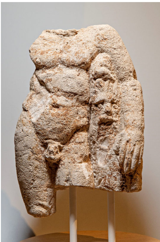
Figuur 3 De Hercules van Valkenburg, gevonden in 1964, verdwenen en in 2018 weer opgedoken in het depot van het RMO

Het verhaal dat de bodem over Romeins Valkenburg vertelt, is volgens De Bruin tot nu toe nooit helemaal uit de verf gekomen. Dat ligt niet aan alle opgravingen die er inmiddels hebben plaatsgevonden en aan wat die allemaal aan materiaal hebben opgeleverd. De Bruin geeft aan dat