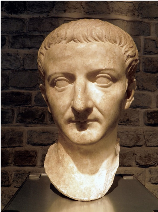
Figuur 5 Tiberius (collectie Römisch-Germanisches Museum, Keulen)

Caligula (afb. 6) voor de verovering van Brittannia. “Er is een munt met zijn 'kop' gevonden”, vertelt De Bruin. “Die munt is later voorzien van een stempel van zijn opvolger Claudius. Die stempel heeft te maken met het feit dat de herinnering aan Caligula werd vervloekt ( damnatio memoriae ). De gestempelde munten zijn maar heel kort in omloop geweest voordat ze werden omgesmolten.”