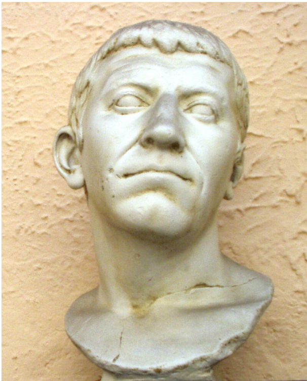
Figuur 7 Corbulo

De derde verklaring voor de aanwezigheid van een groot castellum valt samen met het keizerschap van Claudius. Corbulo (afb. 7) was in die tijd de beste generaal van het rijk. Overal waar problemen militair moesten worden opgelost, werd hij ingezet. “Voorafgaand aan een invasie van Brittannië moeten de flanken van de aanvoerroutes worden veiliggesteld”, redeneert De Bruin. “Vooral de