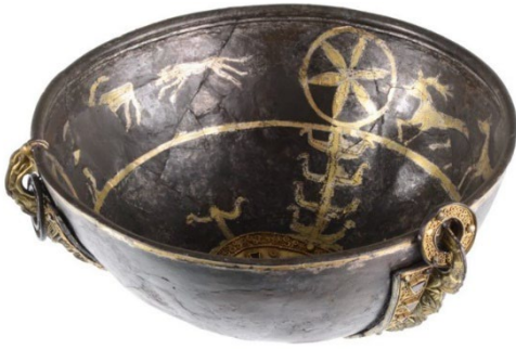
Afb. 2 Schaal van Oegstgeest, Rijksmuseum van Oudheden, Leiden

de tiende en elfde eeuw het graafschap Holland ontstond – die naam zelf komt waarschijnlijk uit deze streek (Holtland bij Koudekerk). Voor de streek zelf raakte de benaming Rijnland in gebruik.