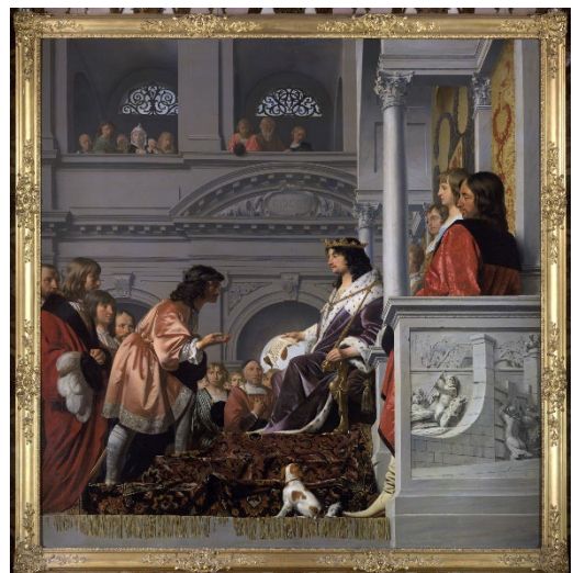
Afb. 3 Verbeelding van de handvestverlening door graaf Willem II van Holland in 1255 aan de heemraden van Rijnland, circa 1655. Collectie van Hoogheemraadschap van Rijnland (Leiden), KGV-000057.

Het grotere regionale verband van Rijnland speelde lang een rol van betekenis. De contouren van Rijnland zijn bijvoorbeeld nog goed te herkennen in het werkgebied van de afdeling van de Nederlandsche Maatschappij der Wetenschappen, dat zich bezighield met de economische ontwikkeling. Bij deze afdeling, genaamd het Departement van de Oeconomische Tak, opgericht in 1778, sloten zich niet alleen Leidenaren aan maar ook inwoners van omliggende dorpen zoals Noordwijk, Voorschoten en Zoetermeer. Weliswaar speelden Leidse ondernemers en hoogleraren een prominente rol binnen de afdeling maar