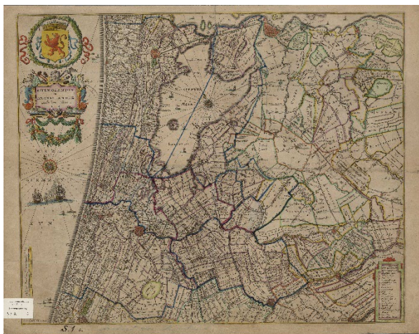
Afb. 1 Kaart van Rijnland en de omliggende waterschappen door Willem Jansz. Blaeu, 1662. Collectie van Hoogheemraadschap van Rijnland (Leiden), A0004