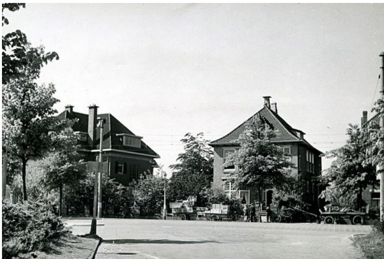
Afb. 1 Rijnsburgerweg 80, eind mei 1944