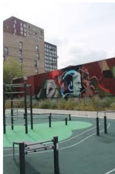
Afb. 3 een stukje Cronestein

Aan de hand van kaarten laat Van Dongen zien hoe anders Cronestein er tijdens de oorlog uitzag. De wijk, nu een snelgroeende wijk, bestond toen uit slechts enkele woningen en bedrijven aan de rand van de stad, omgeven door polders en met weinig verbindingen naar Leiden. Omdat over de oorlogsgeschiedenis van de wijk nog weinig bekend is, vormen herinneringen van bewoners een belangrijke bron. Samen met Van Veen verzamelde zij interviews en persoonlijke verhalen, aangevuld met archiefonderzoek, kranten, politierapporten en lokale publicaties. Juist de combinatie van mondelinge geschiedenis en geschreven bronnen levert een gedetailleerd beeld op van het dagelijks leven in de wijk tijdens de bezetting. De resultaten zullen worden opgenomen in een boek over de