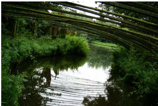
De kooi in Warmond nu