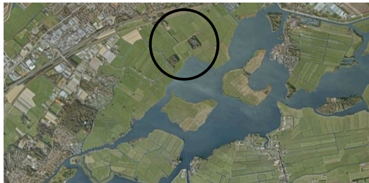
De Warmondse Eendenkooi (in de cirkel)

Er borrelden allemaal ideeën bij Bart naar boven hoe de gemeente Teylingen de eendenkooi zou kunnen beheren. Maar de gemeente zei tegen hem: maak zelf maar een plan. In de zomer van 2018 heeft hij een plan in de gemeenteraad gepresenteerd. Ook de sceptische boeren uit de omgeving die bij de presentatie aanwezig waren, kon hij overtuigen.