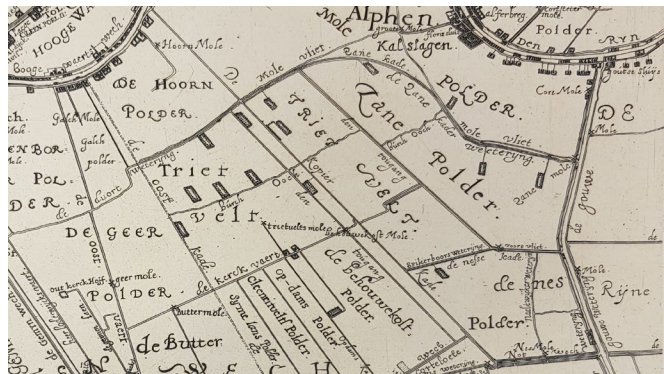
Kooien rond Alphen aan den Rijn