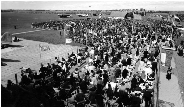
Afbeelding 3 Drukke bij demonstratie voor behoud van Schiphol, 2 juli 1938.

Rotterdam wil Waalhaven behouden en een nieuw vliegveld aanleggen bij Overschie, het latere Zestienhoven. De gemeenten Haarlemmermeer en Amsterdam zijn tegen een vliegveld bij Leiderdorp. Het comité 'SOS-Schiphol' organiseert op 2 juli 1938 een massademonstratie op het vliegveld. Luchtfoto's tonen de enorme aantallen geparkeerde fietsen en auto's. De opkomst was mede zo groot omdat er een gratis vliegshow werd gegeven, weet Diebels. Een evenement waar anders flink voor moest worden betaald. In een optocht rijden wagens met teksten als 'Aalsmeer voor het behoud van Schiphol' en achter een muziekkorps lopen demonstranten met een spandoek 'Nieuwer Amstel strijdt vóór Schiphol'.