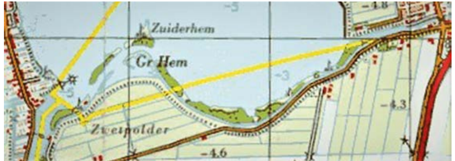
Kaart van de Zuiderhem. Links is de Zuidhoek in Roelofarendsveen te zien en rechts ligt Rijnsaterwoude.

Het Braassemermeer, waar de Zuiderhem deel van uitmaakt, staat plaatselijk bekend als de Braassem. In tegenstelling tot de in de omgeving te vinden verveende meren, is de Braassem deels een van oorsprong natuurlijk meer met een oppervlakte van 425 hectaren. Het westelijk deel, waar het Paddegat en de Zuiderhem bij horen, maakte in vroeger tijden deel uit van het Leidsche Meer, ook van oorsprong een natuurlijk meer. Golfslag en stormvloedvergrootten de omvang van dit meer. Het oostelijk deel van het Braassemermeer is ontstaan door menselijke invloed: het vanuit Rijnsaterwoude ontgonnen veengebied was aan daling onderhevig en raakte daardoor overstroomd. In een oude koopbrief van 1 april 1296 wordt het meer 'die Mere van Rinsaterwald' genoemd. In het zuidwesten van het meer bevindt zich het natuurgebied