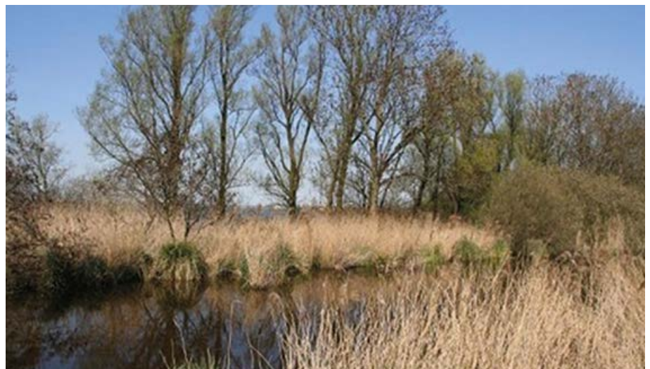
Een foto genomen in het huidige Zuiderhemgebied.

In de Nieuwe Leidsche Courant van 5 april 1930 verschijnt een bericht dat een dreigend gevaar voor Rijnsaterwoude en de omgeving voorspelt. In het artikel wordt gemeld dat de gemeente Haarlem