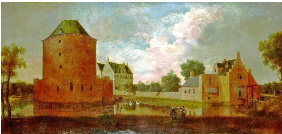
Afb.4: Teylingen in welstand rond 1660.

geheel verwijderd en vervangen door een gigantisch nieuw tweebeukig woonhuis, voorzien van trapegevels. Afb.4 laat slot Teylingen zien in al zijn grandeur van rond 1660 toen dit schilderij gemaakt is. Het voormalige poortgebouw in de ringmuur zou echter pas in 1663 tot jagershuis verbouwd worden en dat is hier duidelijk nog niet het geval. In 1676 zou een felle uitslaande brand de oude woontoren treffen, waarbij het interieur en het dak geheel verloren gingen. Het zou nooit meer opgebouwd worden. De gebouwen op de voorburch hebben het tot aan het begin van de 19 de eeuw uit kunnen houden en werden in 1803 gesloopt.