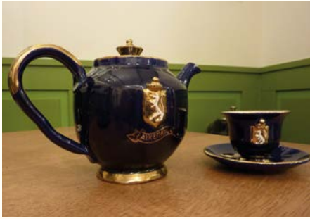
De theepot en één van de kop en schotels uit 1951 in het Museum Oud Alkemade.

en een set van 36 koppen en schotels, alle beschilderd met het gemeentewapen van Alkemade op een koningsblauwe achtergrond. Op eigen initiatief maakte hij nu een vierdelig mokkaservies in tweevoud.