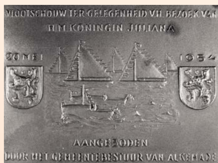
De plaquette t.g.v. de vlootshouw van 20 mei 1954.

Na afloop van het koninklijke bezoek kregen de organisatoren en andere betrokkenen een bronzen herdenkingsplaatje van het gemeentebestuur. Ook Piet de Bil kreeg zo'n plaatje. Zijn weduwe heeft het plaatje geschonken aan de Stichting Oud Alkemade.