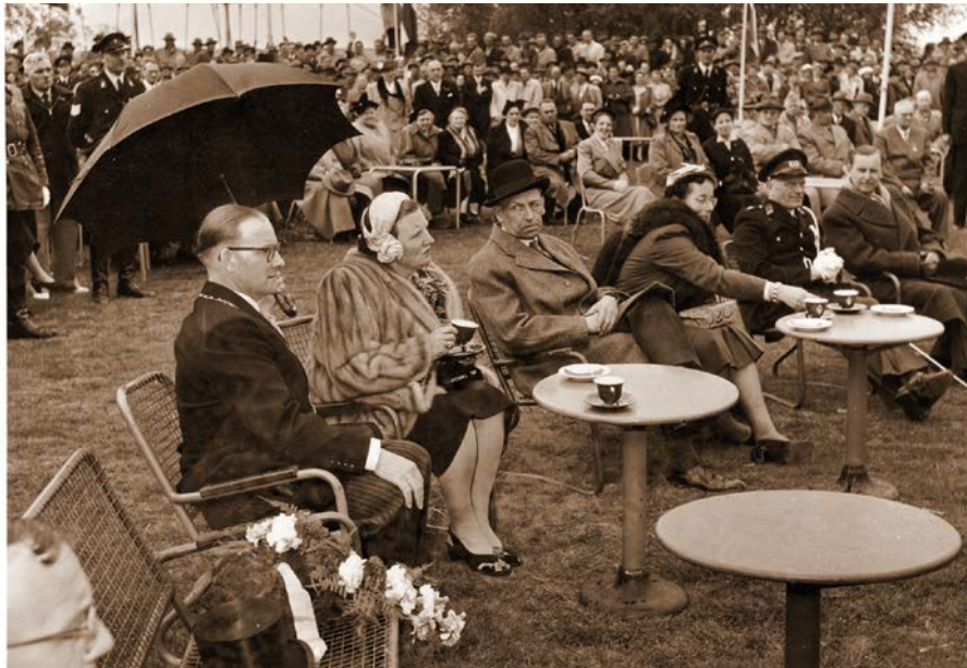
De koningin nipt thee uit een kopje van het servies uit 1951

Op de Woudwetering meerde de politieboot aan bij de los- en laadplaats voor de Nederlandse Hervormde Kerk te Woubrugge. Langs beide oevers van de Woudwetering wederom heel veel mensen, vlaggen en bloemen, en wuivende bewoners van het Hervormde Rust- en Weeshuis (huidige Woudsoord).