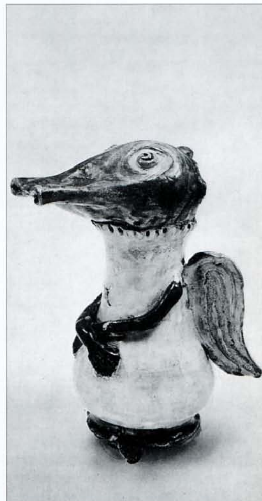
Afb. 6 Potvarken, 1962, particuliere collectie