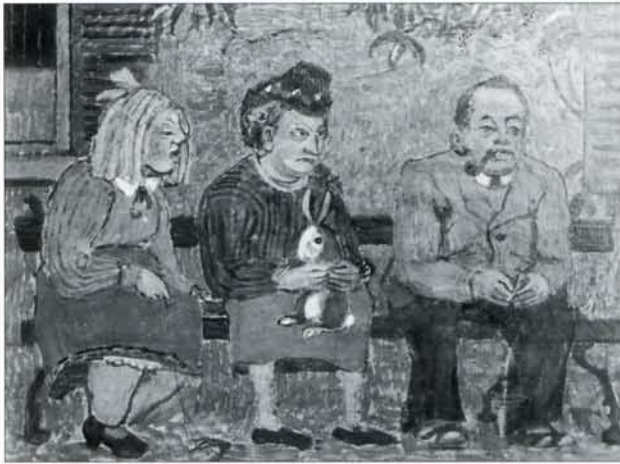
Afb. 5 Harm Kamerlingh Onnes, Patiënten van Endegeest , collectie Museum voor Moderne Kunst Arnhem