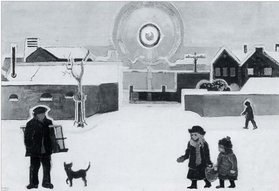
Afb. 2 Harm Kamerlingh Onnes, Winter in Oegstgeest , 1926, collectie Museum voor Moderne Kunst Arnhem

aanwezig in de gedrongen, enigszins vlakke figuurtjes die tegen een geabstraheerde achtergrond zijn geplaatst (afb. 2).