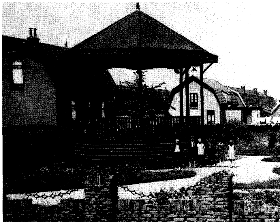
De Voorhoutse muziektent in het parkje tegenover het inmiddels afgebroken gemeentehuis. Foto, ca. 1928/1940.