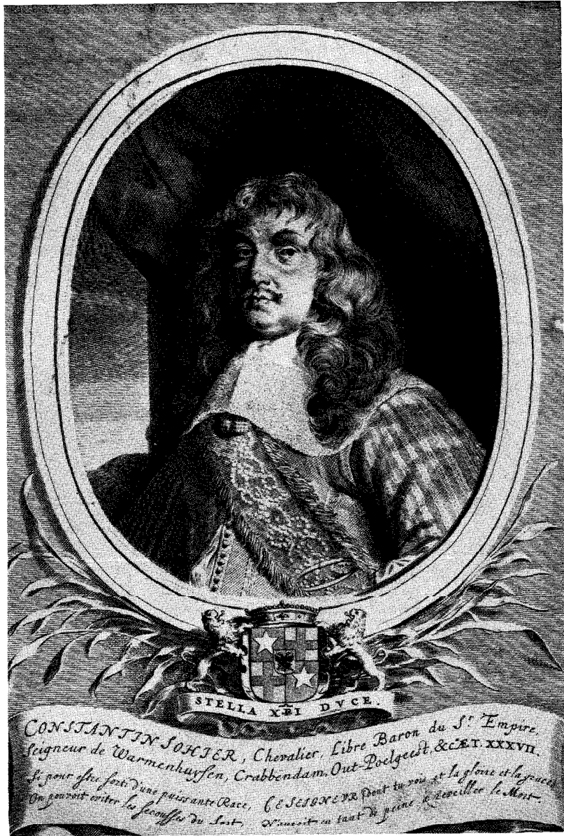
Portret van Constantijn Sohier de Vermandois. Gravure door Pieter Holsteyn, 1661. Rijksmuseum Amsterdam.