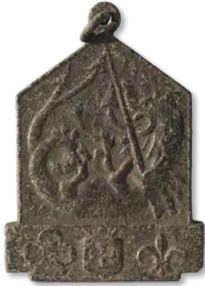
Afb. 8 Medaille uitgereikt bij een 10e deel- name aan de Sint Jorismarsen.