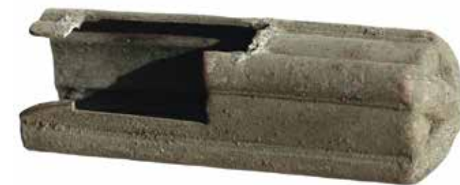
Afb. 6 Monddeksel voor het Nederlandse geweertype M95.

Het messing rijwielbelastingplaatje is voorzien van de jaartallen 1938 en 1939