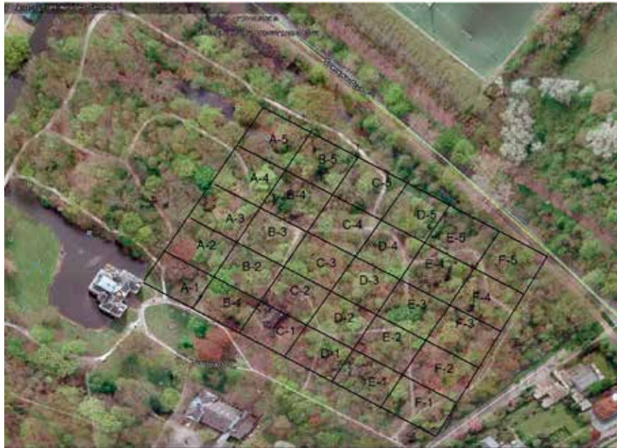
Afb. 3 Het onderzoeksgebied met de vakindeling.

lemmer trekvaart. Het park was eind jaren '30 sterk verwaarloosd. Tijdens de mobilisatie in 1939 trokken Nederlandse soldaten in het kasteel, tijdens de bezetting gevolgd door Duitsers. Berichten dat vrijwel alle bomen in de Hongerwinter door burgers zijn gekapt, lijken sterk overdreven. Een geallieerde luchtfoto van 18 maart 1945, zo'n anderhalve maand voordat de Canadezen hier hun tenten opsloegen, toont de lange schaduwen van vele bomen die op dat moment nog in het park staan. Ook op foto's van het kampement zijn veel bomen te zien. De luchtfoto uit maart 1945 toont de situatie zoals de Canadezen die aantreffen. Op de luchtfoto zijn enkele sporen zichtbaar van Duitse activiteit in het park. Centraal in het westelijk deel van het park zijn twee U-vormige structuren te zien, met de open zijde richting een bospad. Het gaat hier waarschijnlijk om door de Duitsers aangelegde kuilen met een opgeworpen wal eromheen, die dienden als scherfvrije opstelplaats voor voertuigen, zogenaamde Splitterboxen . In een krantenartikel uit 1997 herinnert een ooggetuige zich: "De Duitsers had-