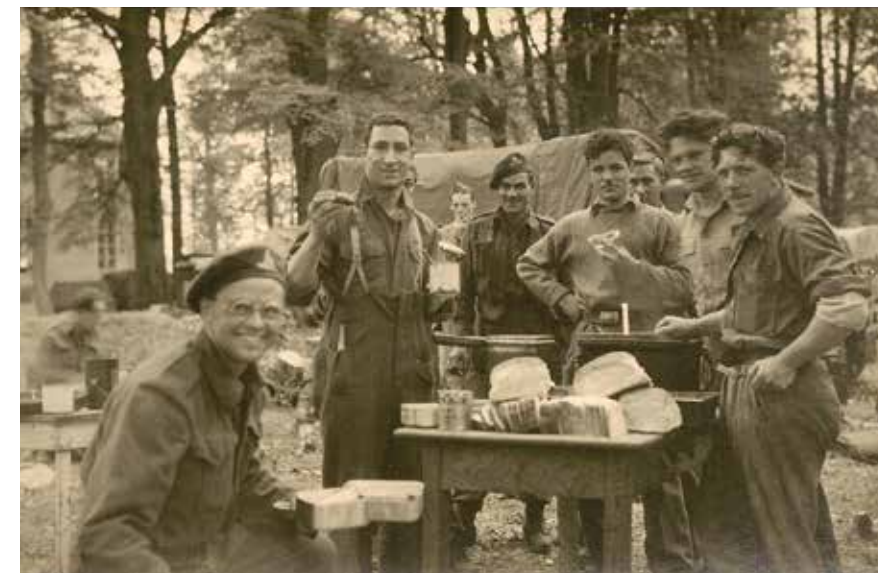
Afb. 4 Canadese soldaten poserend rond een tafel, met op de achtergrond kasteel Oud-Poelgeest.

ben ik daar getuige geweest van zo'n geëxalteerde vrijpartij in het riet waar het te drassig was om tenten op te zetten", waarna de vrijpartij kleurrijk wordt beschreven. Andere berichten laten zien dat dit geen artistieke inkleuring van de werkelijkheid is, zoals een zedenpreek in De Burcht van 23 juni 1945 onder de titel "De houding van onze meisjes". De meisjes worden zelfs vermeld in het War Diary van de 57 Battery, 1 A/Tk Regt, waarin op 14 mei staat genoteerd: "This Bty [Battery] never had such hospitality as now, with pre-war liquor, fine homes and friendly young females. Curfew rather curtails the activities but it is hoped that this will soon be lifted." (Vertaling: "Deze batterij heeft niet eerder zulke gastvrijheid gehad, met vooroorlogse drank, goed onderdak en vriendelijke jongedames. De activiteiten worden nogal beperkt door de avondklok, maar we hopen dat die snel zal worden opgeheven") Een van de foto's geeft een goed beeld van wat er aan metaalvondsten van het Canadese kampement kan worden aangetroffen (afb. 4). We zien zes man poserend rond een tafel met eten en nog enkele personen in de achtergrond. Diverse metalen voorwerpen zijn duidel-