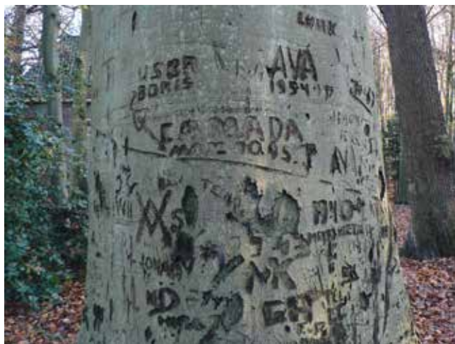
Afb. 1 De inscriptie CANADA, MAY 10 45 tussen andere inscripties op een beuk bij Oud-Poelgeest.

“Opvallend is de geringe aandacht van amateurarcheologen voor archeologie van de Tweede Wereldoorlog”, zo werd in 2011 geconstateerd bij een inventarisatie van tijdens archeologisch onderzoek aangetroffen oorlogsvondsten. 2 Ter gelegenheid van het Westerheem-themanummer over archeologie van de Tweede Wereldoorlog is in 2014 een enquête gehouden onder amateurarcheologen om te onderzoeken waarom ze zich wel of waarom juist niet bezighouden met archeologisch onderzoek naar de oorlogsjaren. 3