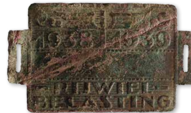
Afb. 5 Rijwielbelasting- plaatje.

Wanneer we kijken naar de vondsten in deze functiegroepen valt op dat enkele logisch aansluiten bij het gebruik van het terrein als openbaar toegankelijk wandelpark. Typische ‘parkvondsten’