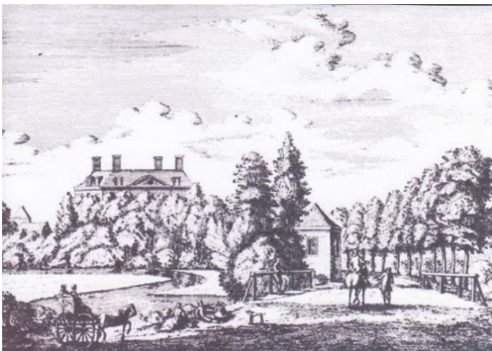
2 Huis Meerenburgh te Lisse, bewoond door de Heren van Alkemade

Hoewel de documenten over het verloop der gebeurtenissen direct daarna geen afdoende duidelijkheid geven mag verondersteld worden dat de kerkenraad spoedig contact zocht met de Heer van Alkemade. Deze was kennelijk van mening gebruik te kunnen maken van zijn volledig patronaatsrecht, dus met inbegrip van zijn betrokkenheid bij de nominatie van predikantkandidaten.